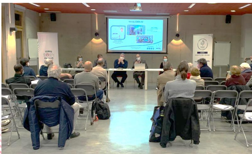
Réunion du C.A élargi aux présidents des comités sportifs - Sèvres