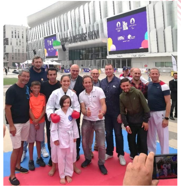
Live des Jeux Olympiques et Paralympiques Colombes et Nanterre