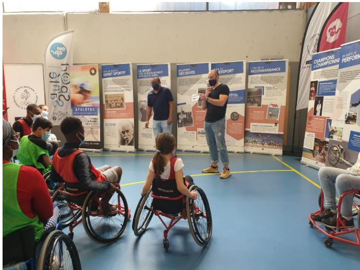
1 ère Journée Handi'OMEPS - Nanterre