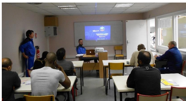
Formation arbitrage de football – (CPHS Nanterre)