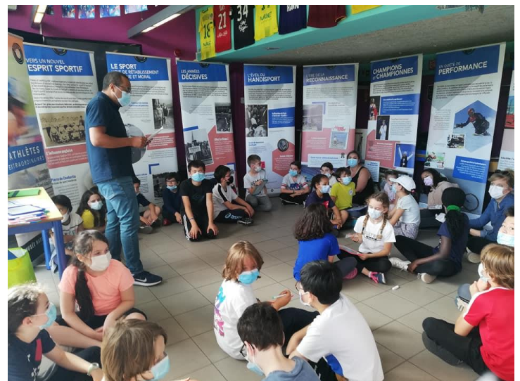
Opération « Foot à l'école » USEP 92 - Montrouge