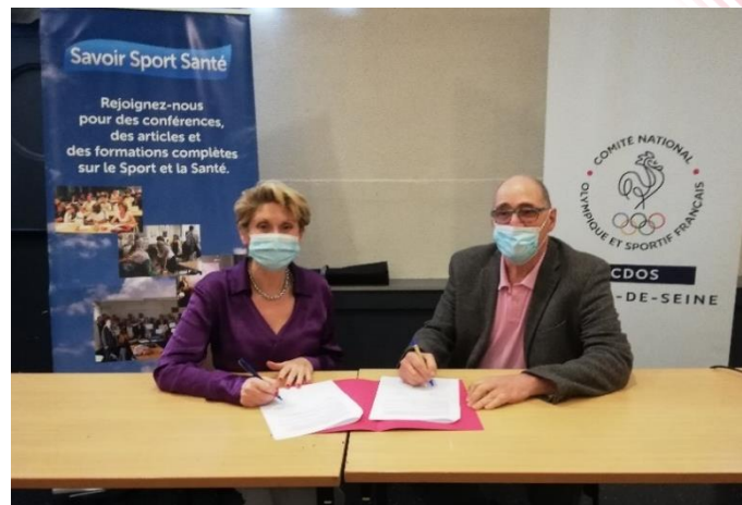
Signature de la Convention - Nanterre