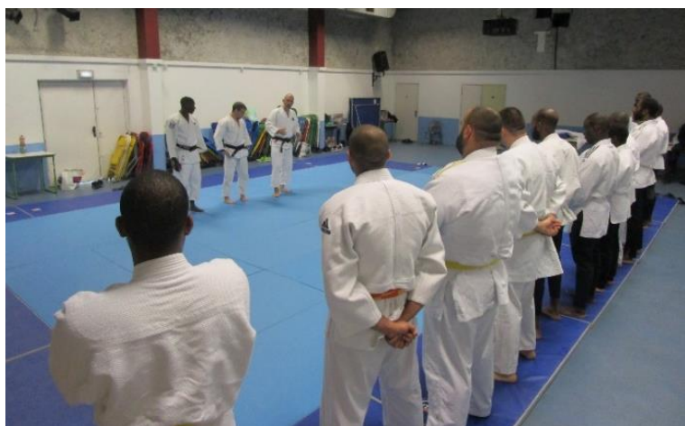
Session judo – CPHS (Nanterre)