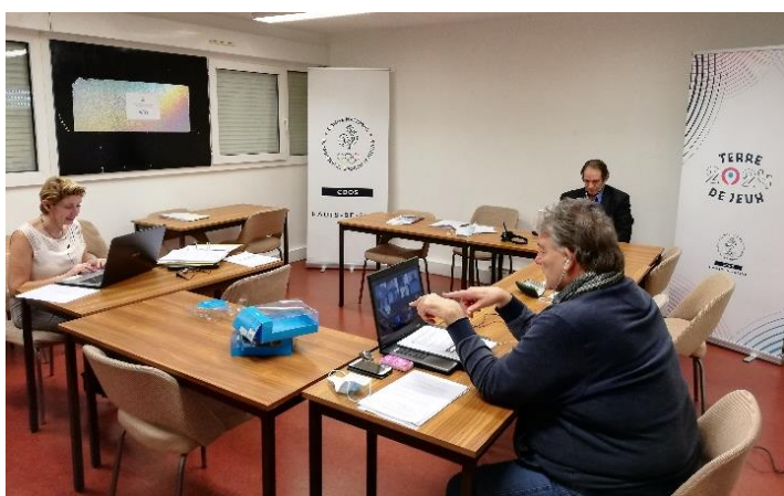
Formation Sport Santé en visioconférence