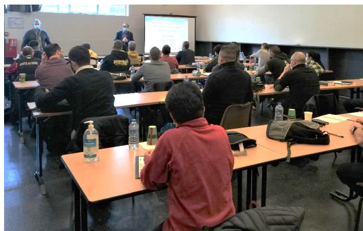
Formation Sport Santé Prescri'forme - Nanterre