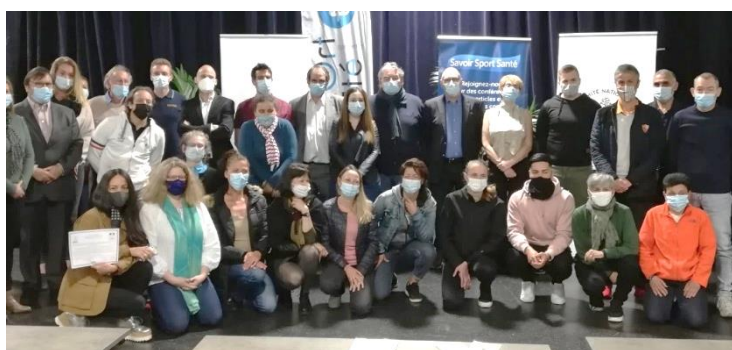
Remise des attestations de réussite 2021 - Nanterre