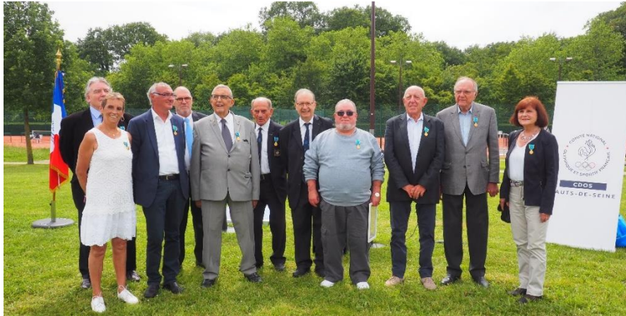
Remise des Médailles du CDMJSEA 92 – Haras de Jardy