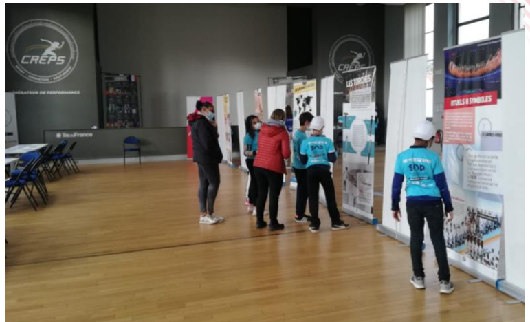
Semaine Olympique et Paralympique 2021 – Colombes et Châtenay-Malabry