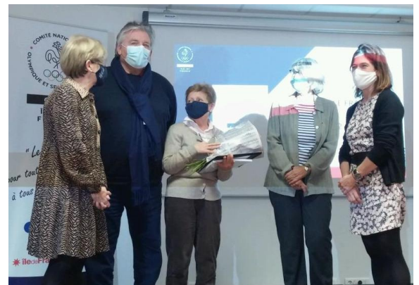
Cérémonie « Femmes en OR 2021 » - CROS IDF