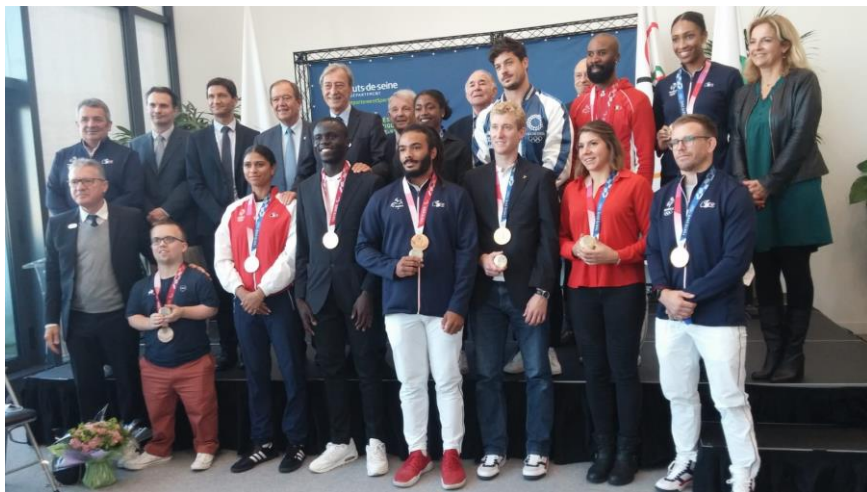
Cérémonie des médaillés de Tokyo 2020 – Conseil Départemental