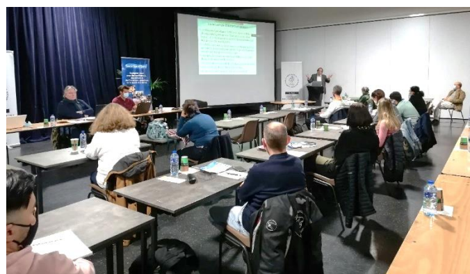
Les Rendez-vous Sport Santé des Hauts-de-Seine Mai et Décembre 2021 – Nanterre et Villeneuve- la-Garenne