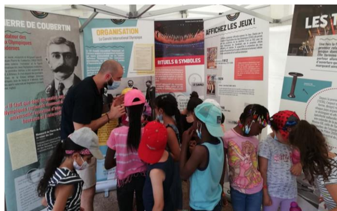
Journée Olympique et Paralympique – Colombes, Meudon et Montrouge