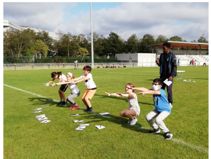
Journée Nationale du Sport Scolaire 2021 – Asnières et Gennevilliers